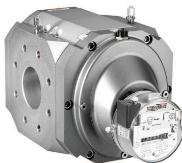
RABO + ENCODER SID