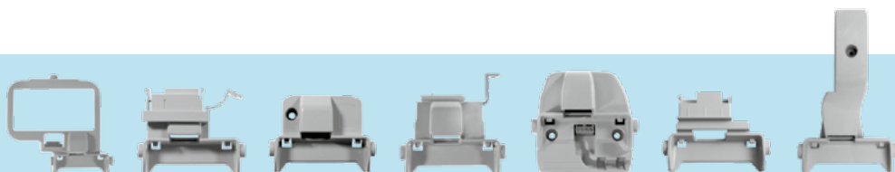
IC Rx15 Itron RF1

Zahvaljujući posebno namenjenim adapterima APULSE X3x5 može da se koristi sa različitim vrstama brojlara: